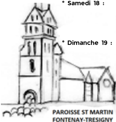
PAROISSE ST MARTIN FONTENAY-TRESIGNY